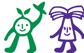
Welcomingアベノ・天王寺キャンペーンのキャラクター「あのくん」と「てのんちゃん」

アベノ・天王寺エリアの魅力を再発見し、それを伝えることで、エリアのイメージ向上、活性化を目指していきます。「Welcoming」は、アベノ・天王寺エリアにさまざまな人をお招きし、おもてなしをしていくという気持ちを表現しています。